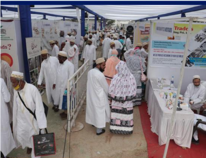
سيئي برھاني 2021 expo طاھراباد

مولانا المنعم طع یر وارموار واضح فرمايو ڪر اپ ني خوشي سون چيز ما چھ، یر سون؟ ڪر مؤمن Business Minded ھوئي، عشرت مبارڪت دوران اپ مولی طع یر فرمايو ڪر Business Minded ھووا ني سون معنی چھ، انے ڪي شاکلة سي جيوارے هر مؤمن آخرت نا