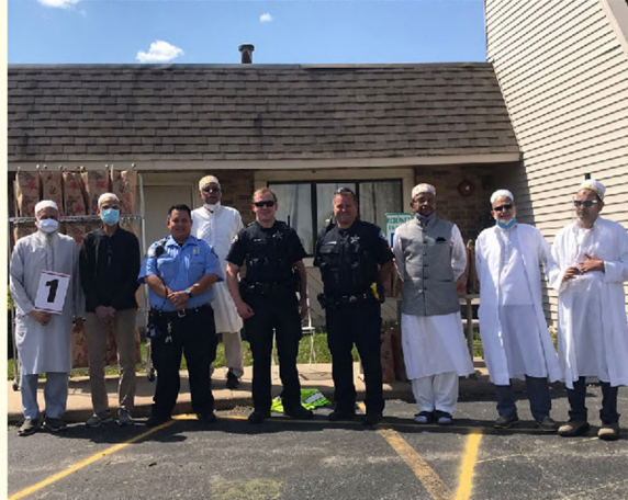
انزههار المجتمع في شمال شيكاغو