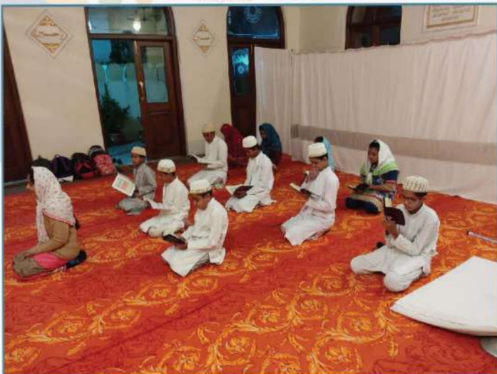
مؤمنین نا فرزندو حفظ القران کری رہیا چھے۔ ویدھیشا

دعا یمانیین عظام ہر نا زمان ما علم حاصل کروانے سینکڑو میل فی دوری طی کرتا ہوا ہندوستان سی طلاب العلوم۔ داعی الزمان فی حضره ما علم حاصل کروانے حاضر تھا تا ، یر ۷ مثل ہندوستان ما جہان کہانہ داعی الزمان تشریف مراکھے۔ وہانہ علم نا طلاب اوی نے داعی فی کفاله ما تربیہ و تعلیم حاصل کرتا ، اشاکلہ سی اپنا مولی کرام ۲۴ یر زمانا و سی مؤمنین نا تعلیمی امور واسطے سعی بلیغ فرماوی ، یر تمام مساعی جلیلہ نا مظاہراج نا عصر میمون ما نظر اوی رہیا چھے ، علم نا فوائد حاصل کروانے۔ عالم ایمان نا کونا کونا سی مؤمنین جوق در جوق داعی الزمان طع فی حضره ما پہنچی جائی چھے ، بالخصوص۔ ہر سال العشره المبارکہ ما۔ ہزارو بلکہ لاکھو مؤمنین حقیقی صین طرف ہجرہ کرے چھے ، انے تمام علم نا خلاصہ۔ امام حسین ۲۴ فی ذکر سنی بہرہ ور تھائی چھے ، یر ۷ مثل علم نا مرکز۔ الجامعہ السیفیہ فی طرف ہر سال "الاستفادہ العلمیہ" فی برکات حاصل کروانے۔ مؤمنین فی تعداد زیادہ تھائی جائی چھے ، عجب ان زمان فی شان چھے! عجب ادعاتو نوا احسان چھے! جر علوم حاصل کروا واسطے دور دراز مسافہ طی کروی